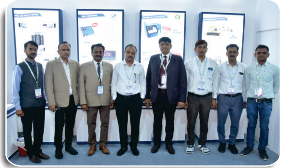
REIL Team at Company's stall