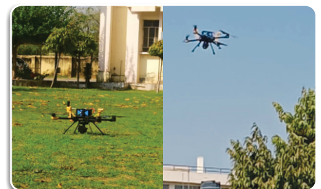
Drone take-off and Flying for Survey

REIL has established GIS lab and supplied Servers, laptops, workstations including installation of related softwares at RIICO premises for data handling, management & modifications purposes.