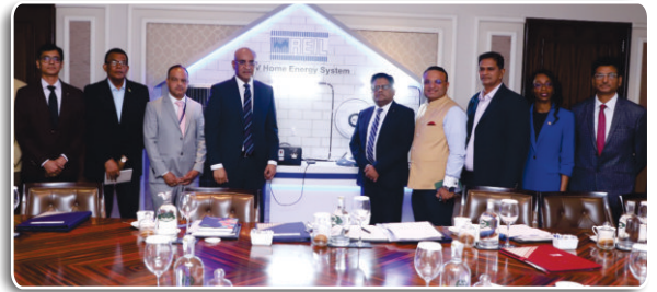
Seniors Officials of REIL and Cooperative Republic of Guyana during the meeting

A meeting was held with Dr. Bharat Jagdeo, Hon'ble Vice President, The Co-operative Republic of Guyana at Hotel Taj Palace, New Delhi on 21.02.2023 wherein Guyana Finance Minister, Director General Agriculture, Republic. of Guyana, Indian High Commissioner in Guyana, officials of embassy and TERI were also present.