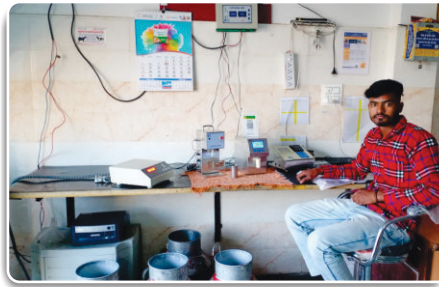
REIL's Dairy solution- DPMCU at work, at Bansa Society, Mehsana, Haryana

Apart from this, the Company received regular orders of 168 nos. of Electronic Milk Tester, 1332 nos. of Milk Analyzers, from various milk cooperatives / customers across the Country.