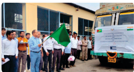
MD REIL Flagged-off the first consignment to Guyana

Company initiated the execution of it's prestigious export order by dispatching a consignment of 1331 nos. SPV Home Energy Systems to Guyana Energy Agency (GEA).