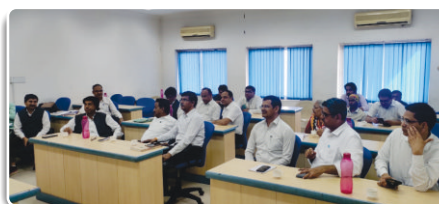
REIL Officials during the training

For bringing more ease and transparency, Google Location based Mobile App has been designed and developed by IT team for Attendance Management System. Training cum Demonstration Program was organized on 25.02.2023 at REIL premises for educating users on its usage. Continuous support services were also provided for in-house developed solutions during the quarter.