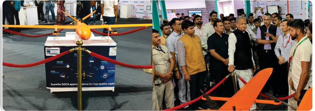
Dignitaries during their Visit and discussing on Drone system exhibited by REIL on 19.03.2023

Department of Information Technology and Communication, GoR marked Rajasthan IT day from 19-21 March 2023, with a grand showcasing of state's IT and start-up infrastructure, wherein REIL displayed superior DGCA approved Drone for high quality capturing. Towards fulfilling the need for digitizing land records, REIL has recently diversified in the area of Geospatial Drone Survey and executing a project for GoR for an aerial survey at their approx. 441 Industrial Areas (IAs).