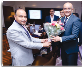
MD REIL Welcoming the Hon'ble Vice President