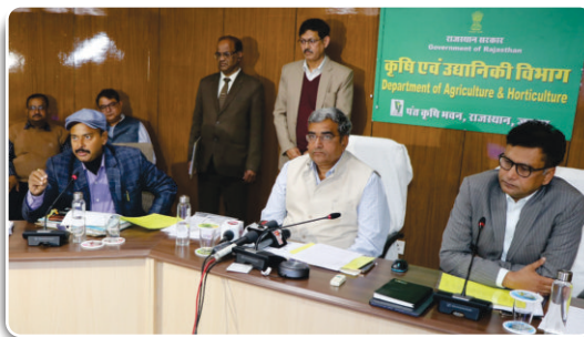
Glimpse of inauguration ceremony