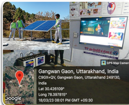
SPV Smart Classroom in Govt. School Tehri (Uttarakhand) under THDC CSR Activity

MD REIL and team presented the live demonstration of SPV Home Energy System which are being supplied in Guyana for Hinterland Communities against the recent order & REIL's expertise in various areas of operations. The Vice President Guyana appreciated REIL capabilities in terms of expertise in Solar installations across PAN India for upliftment of rural masses and has assured for a long term association with REIL.